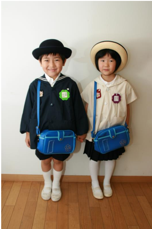
冬服（左） ・ 夏服（右）