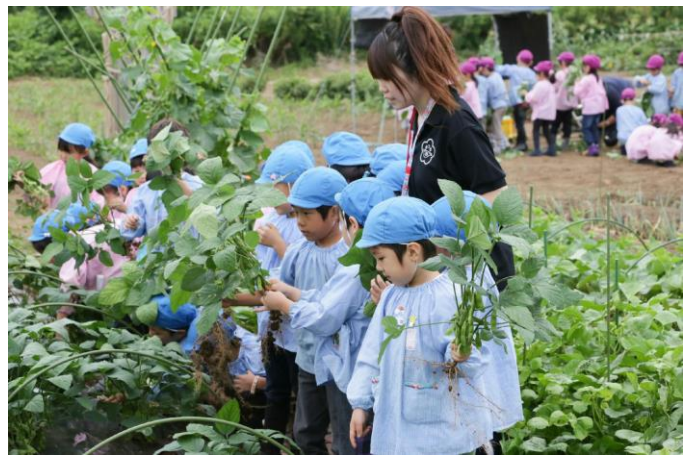
お泊り保育(あすなろの里)収穫体験