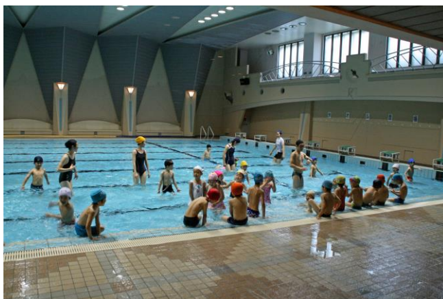
正課体操 水泳練習（清島温水プール）