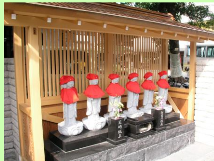
幼稚園門脇の六地藏さま