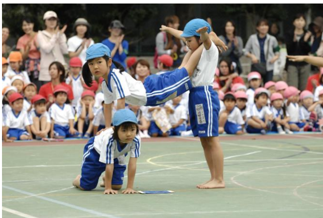
運動会 年長児組体操